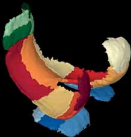
3D model chrupavky