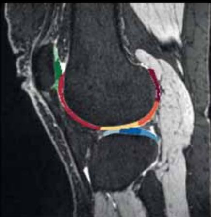
Segmentácia kolennej chrupavky pomocou AI

Automatizovaná, kvantitatívna a štruktúrovaná analýza kolennej chrupavky pre systém syngo.via